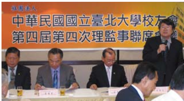
侯校長於會中致詞