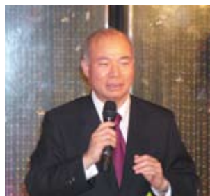
王理事長於會中致詞