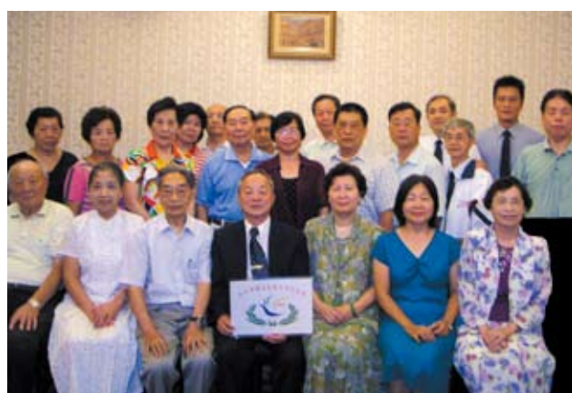
戴主任(前排右3)同與會校友合影留念