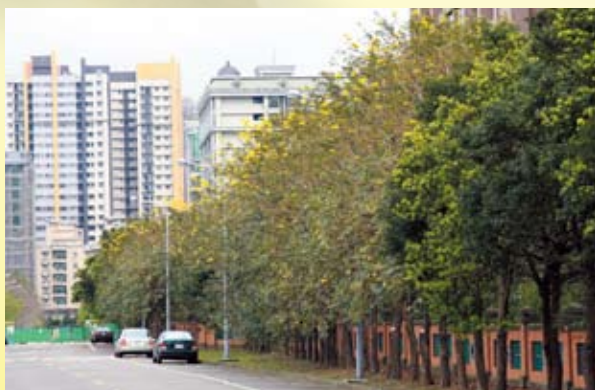
三峽校園矮牆邊的黃花風鈴木